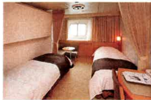
コンフォートステート (3層80室) 14㎡シャワー、トイレ付 (2層17室) 14㎡シャワー、トイレ付