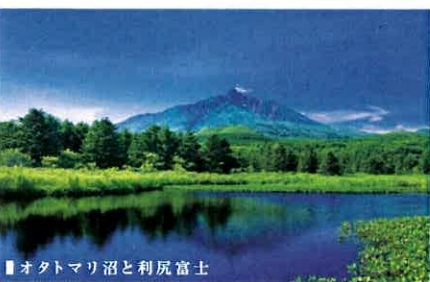
オタマリ沼と利尻富士