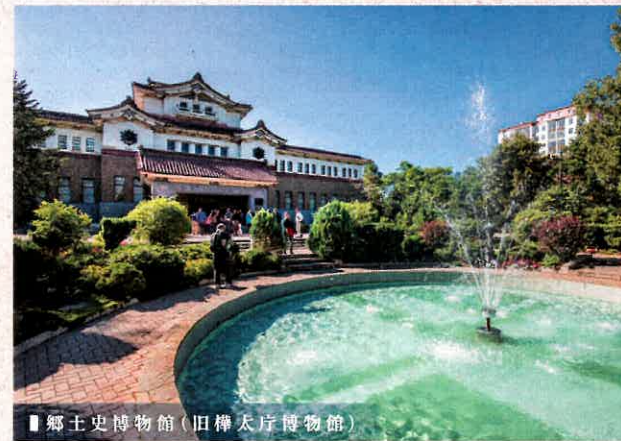
郷土史博物館(旧樺太庁博物館)