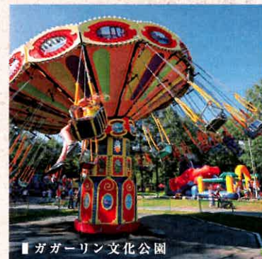
ガガーリン文化公園