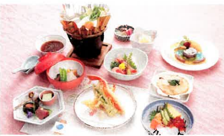
※写真は実際のメニューとは異なります。

美味しい北海道の旬の食材で、にっぽん丸の料理長が腕ふるう特別ディナーです。北の幸を和食でお楽しみいただきます(クルーズ中1回)。