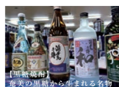
【黒糖焼酎】 奄美の黒糖から生まれる名物