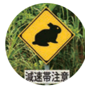
アマミノクロウサギ標識