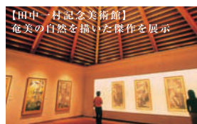
【田中一村記念美術館】 奄美の自然を描いた傑作を展示