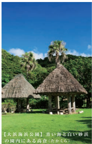
【大浜海浜公園】 青い海と白い砂浜の園内にある高倉(たかくら)