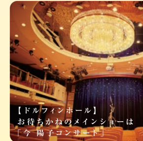
【ドルフィンホール】 お待ちかねのメインショーは「今陽子コンサート」