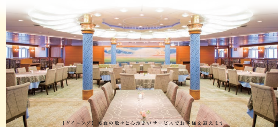
【ダイニング】 美食の数々と心地よいサービスでお客様を迎えます