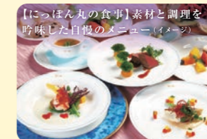
【にっぽん丸の食事】 素材と調理を吟味した自慢のメニュー(イメージ)