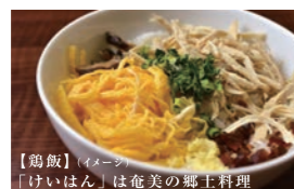
【鶏飯】(イメージ) 「けいはん」は奄美の郷土料理