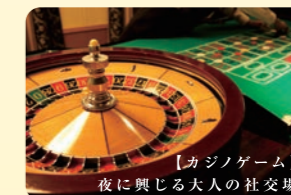
【カジノゲーム】 夜に興じる大人の社交場