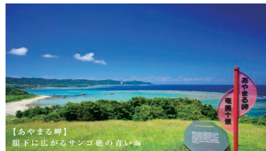
【あやまる岬】 眼下に広がるサンゴ礁の青い海