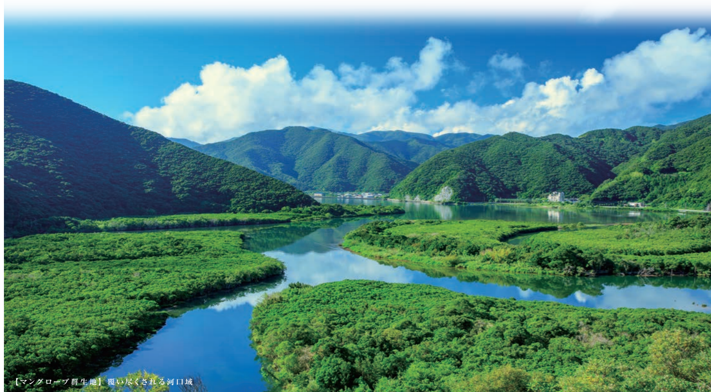
【マングローブ群生地】 覆い尽くされる河口域