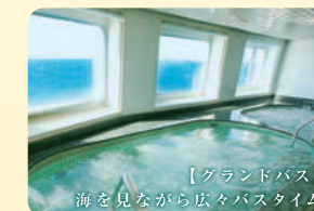
【グラウンドバス】 海を見ながら広々バスタイム