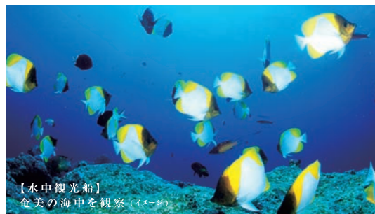
【水中観光船】 奄美の海中を観察(イメージ)

※写真は全てイメージです。※野生動物はご覧いただけない場合があります。※花の見頃は例年と異なる場合があります。