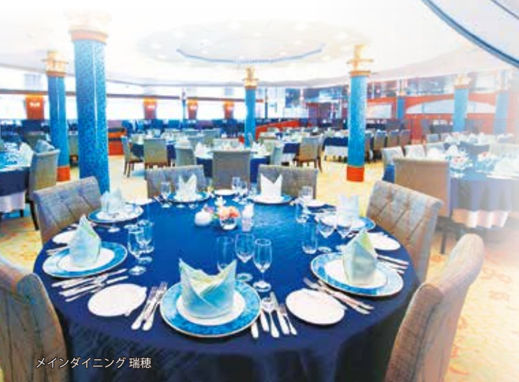
メインダイニング 瑞穂